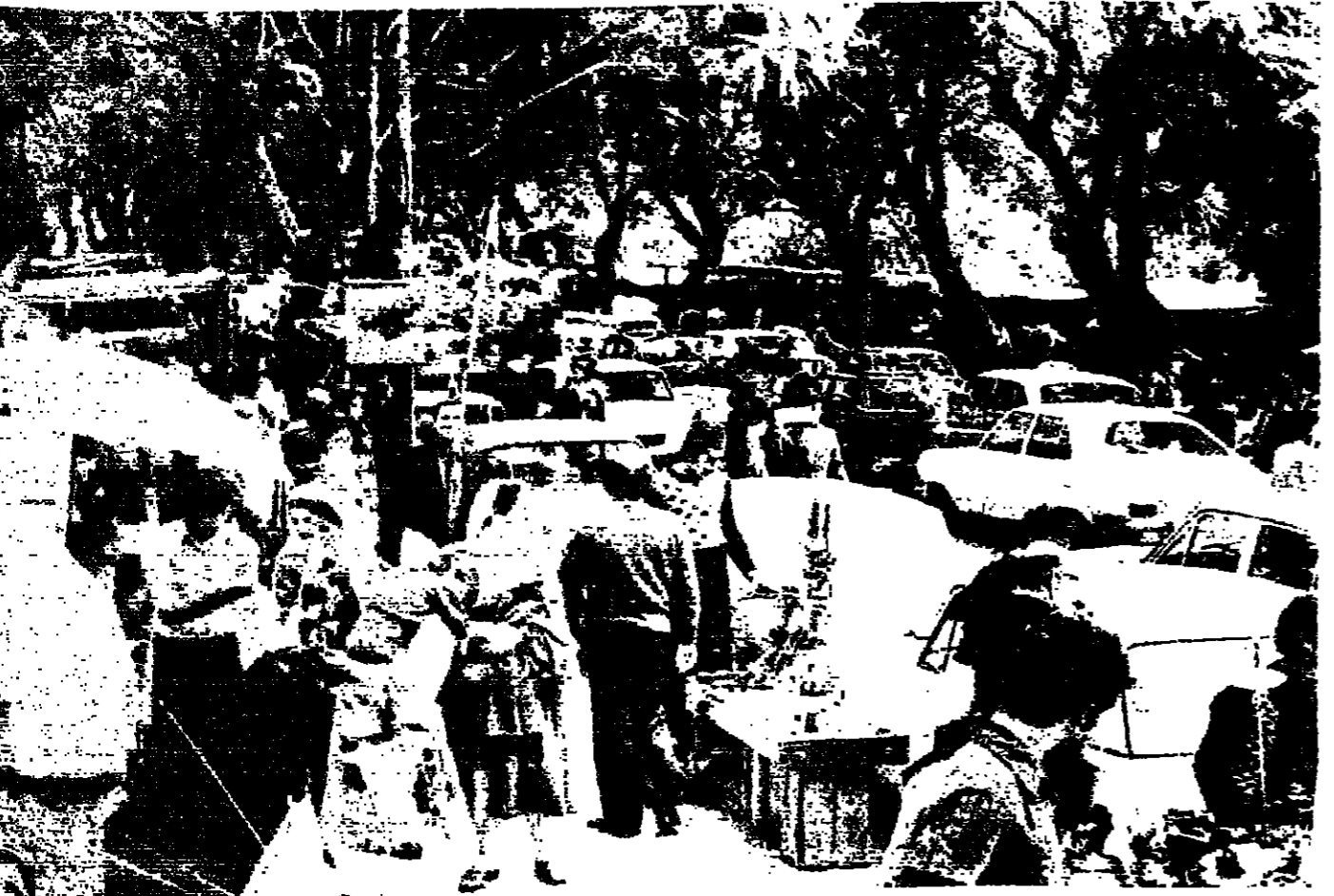
حشد من الباعة والبائعين من حرمه الصناع